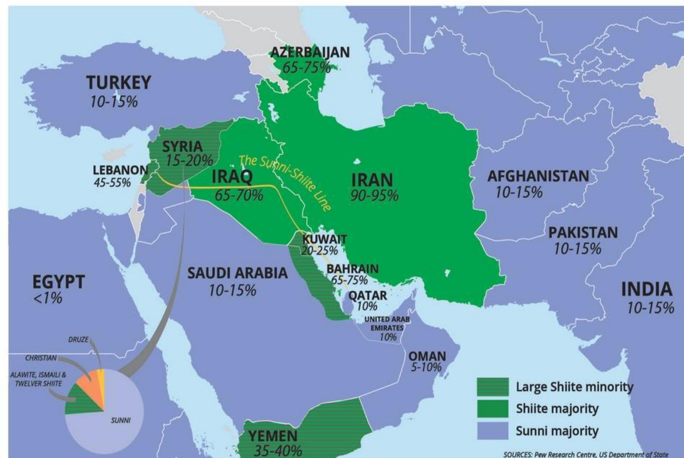
Lines in the Sand: Shiites as % of Muslim Population