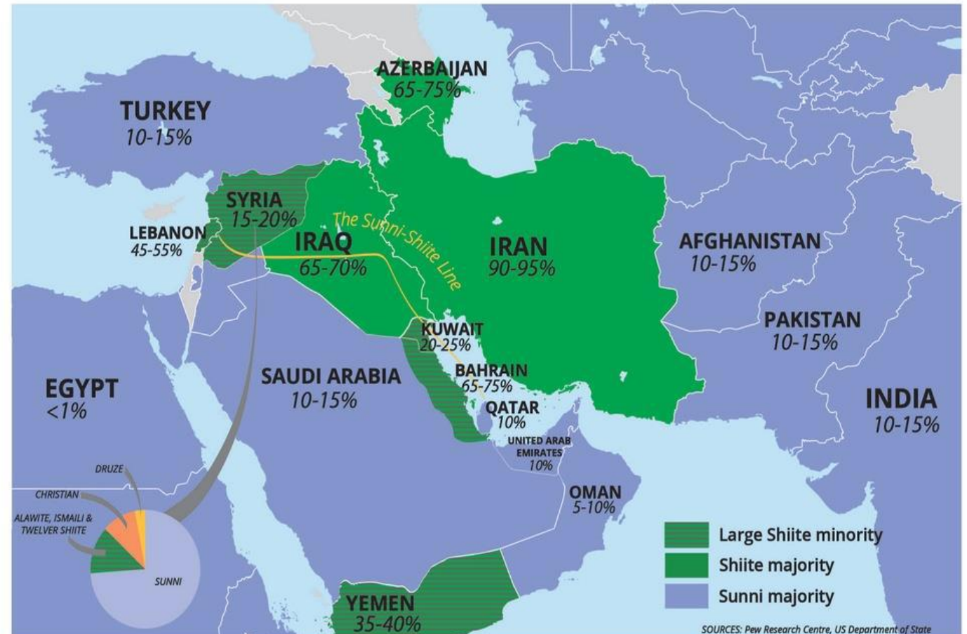
Lines in the Sand: Shiites as % of Muslim Population